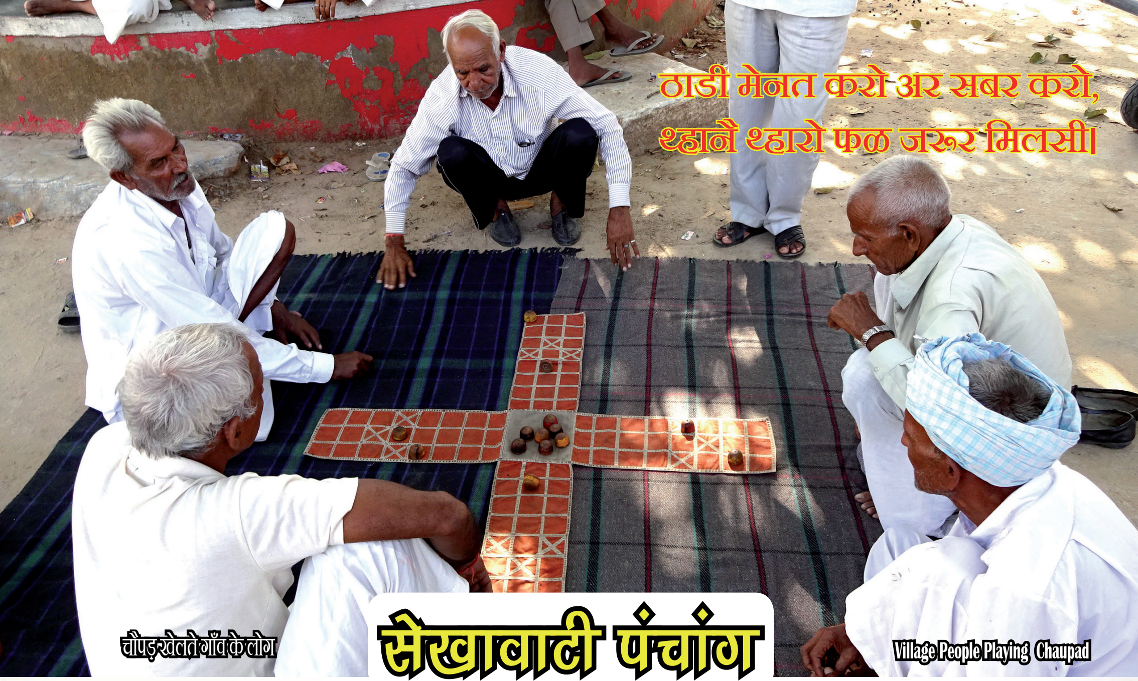
चापड खेलेतों गाँव के लोग

ठाडी मेनत करो अर सबर करो, थ्यानै थारो फल जरूर मिलसी।